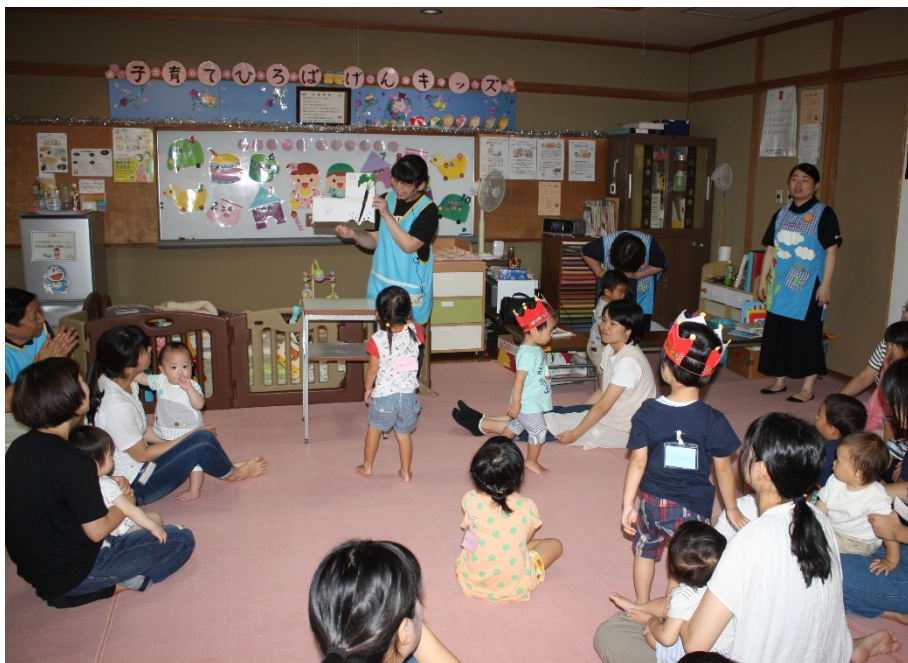
お誕生日会の様子です。ボランティアさんが読み聞かせをしてくれています。